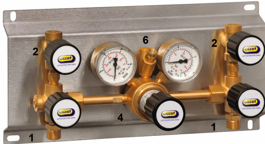
Abb. 1: Entspannungsstation GVA/L-SI-2X1 für 2x1 Gasflasche/Bündel Sauerstoff/Inertgas